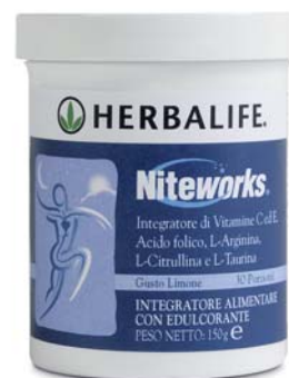
Niteworks™ cod. 0036

Una combinazione di ingredienti appositamente studiata per stimolare la produzione di ossido nitrico